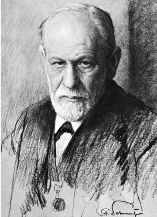
SIGMUND FREUD, El malestar en la cultura . Biblioteca nueva, Madrid, 1968

El psicoanalista tiene sobre la génesis del sentimiento de culpabilidad una opinión distinta de la que sustentan otros psicólogos, pero tampoco a él le resulta fácil explicarla. Ante todo, preguntando cómo se llega a experimentar este sentimiento, obtenemos una respuesta a la que no hay réplica posible: uno se siente culpable (los creyentes dicen «en pecado») cuando se ha cometido algo que se considera «malo»; pero advertiremos al punto la parquedad de esta respuesta. Quizá lleguemos a agregar, después de algunas vacilaciones, que también podrá considerarse culpable quien no haya